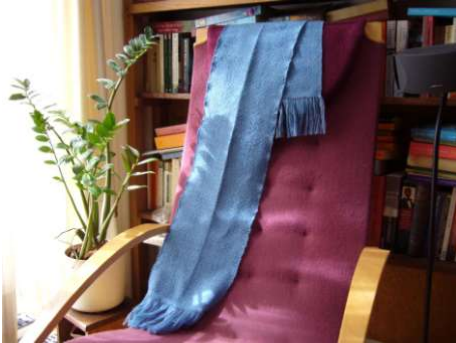
Herenshaw, schaduwweefsel (20 schachten) , merinos wol - op bestelling