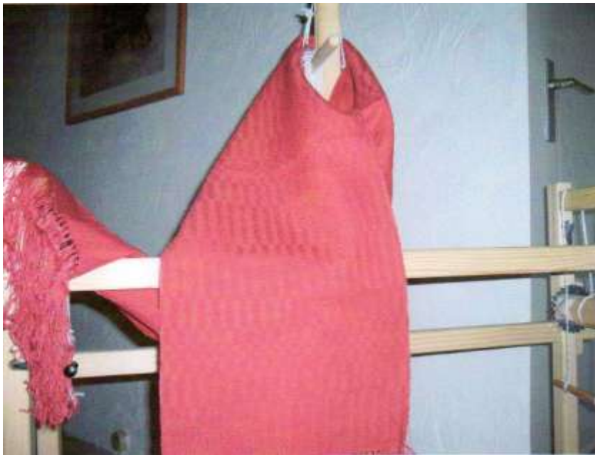
Blok-weefsel, schappe-zijde (schering), merinos-wol (inslag)