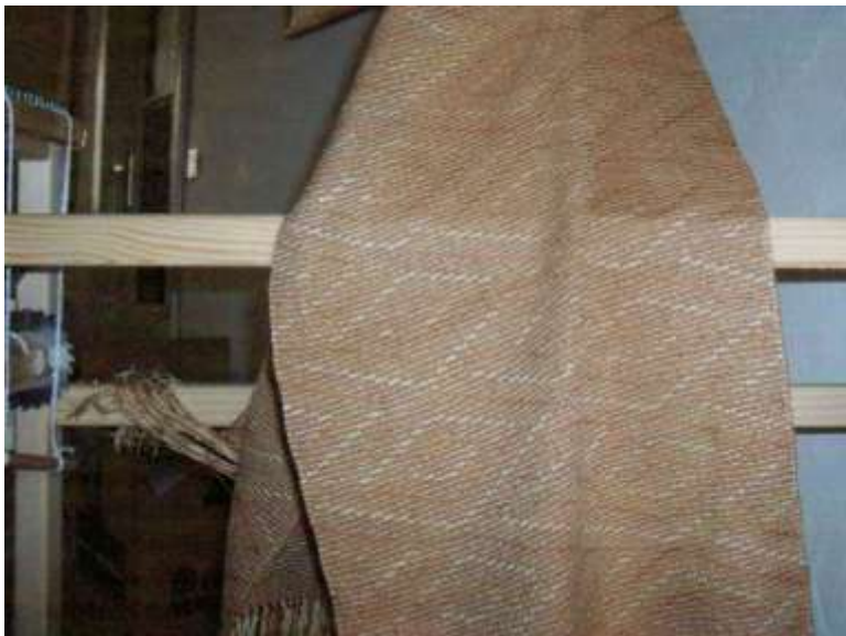
Schaduw-weefsel, tussah-zijde (dubbeldraads)