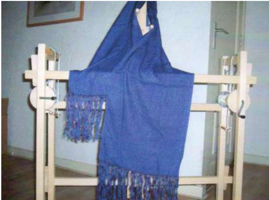
Schaduw weefsel, tussah-zijde