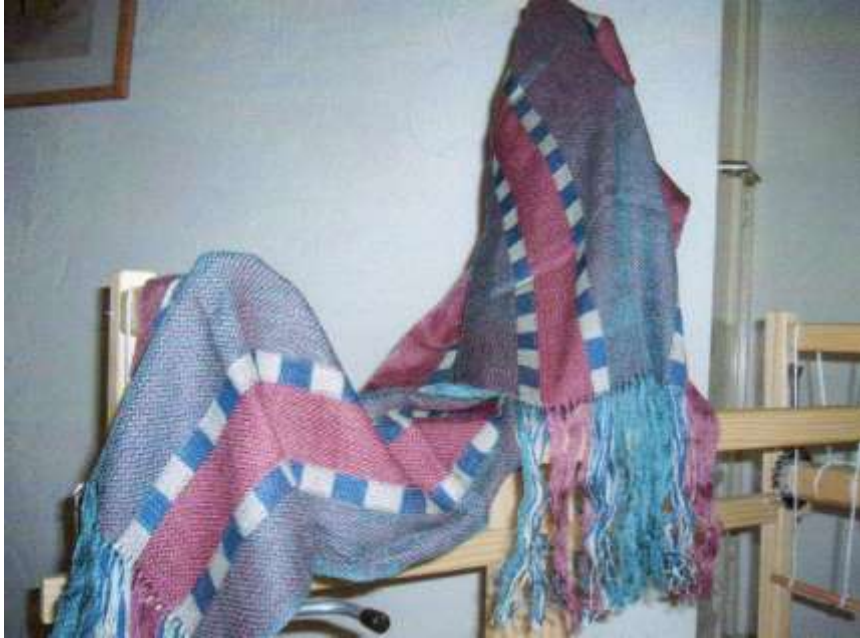
Gedraaide tacqueté. Tussah-zijde