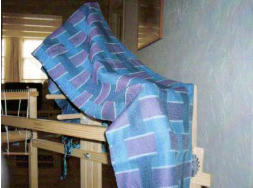
Summer & Winter, schappe-zijde