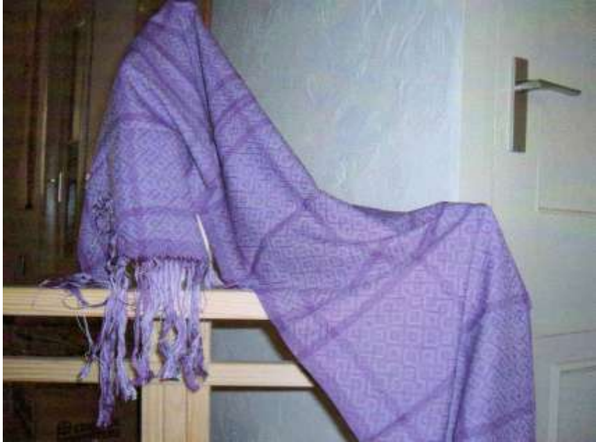
Schaduw weefsel, schappe- zijde