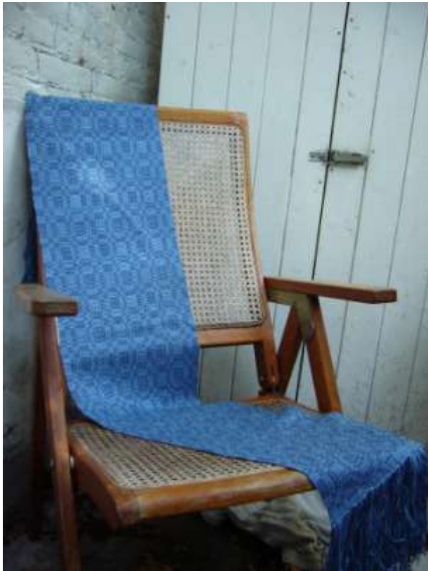
Fins dubbelweefsel (16 schachten), schappe zijde (schering), merionos wol (inslag)