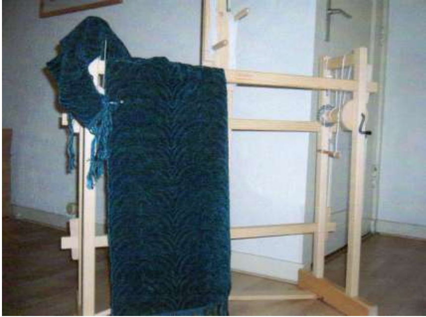
Schaduw weefsel, schappe –zijde (schering), zijden chenille (inslag)