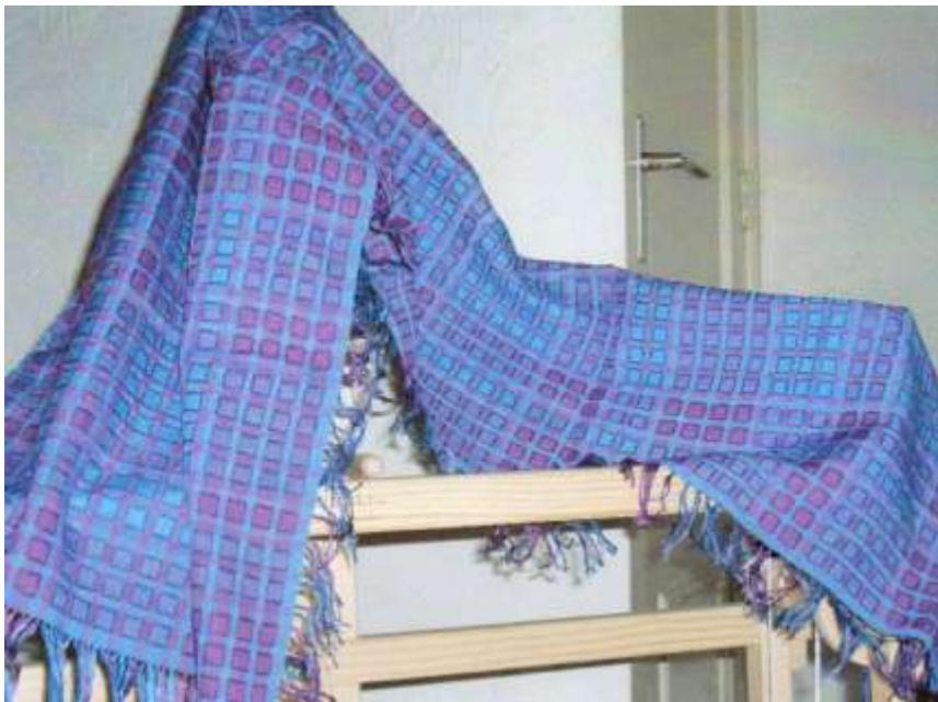
Blokweefsel, schappe zijde (schering), tussah-zijde (inslag)