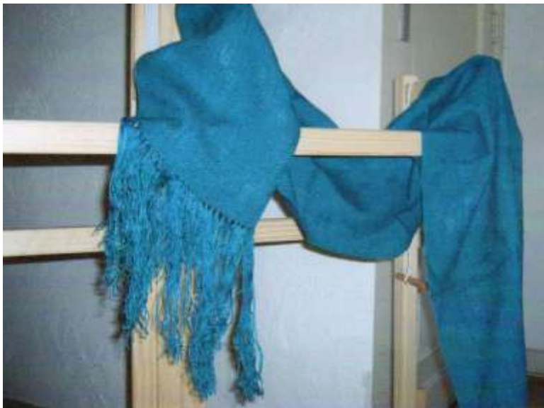
Sålvävning, tussah- zijde