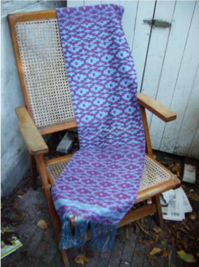
Lampas, face-changed (25 schachten), schappe zijde (schering), schappe en tussah zijde (inslag)